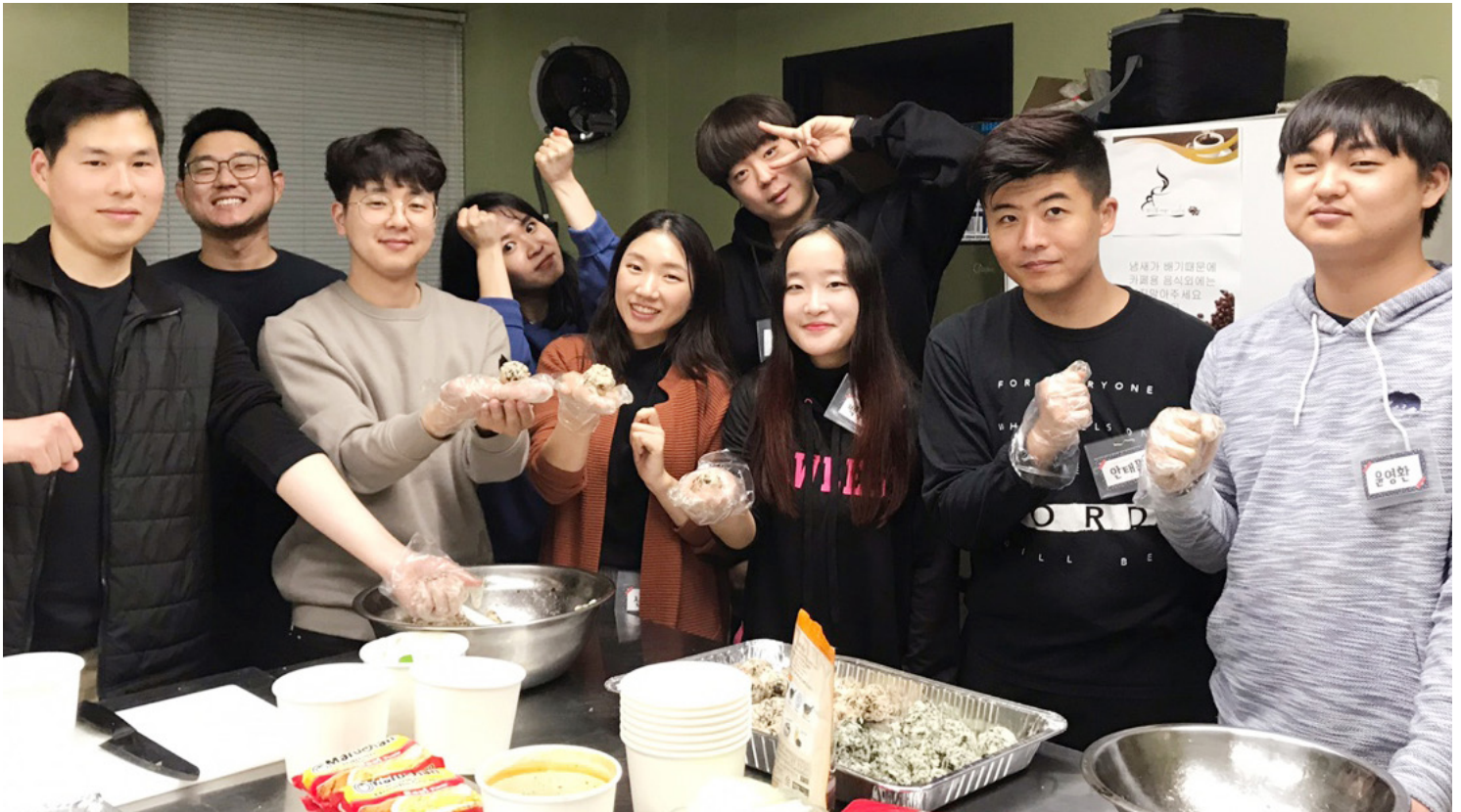
코람데오 한어청년부 회원들이 예배 후 함께 음식을 만들며 즐거워하고 있다.

주안예교회 InChrist Community Church f ig ph. 818.363.5887 | 문서국 e-mail: icccnews123@gmail.com | web: icccla.org